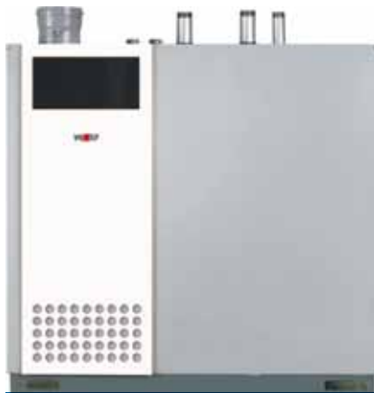
Obr. 2 – Stacionárny kondenzačný kotol MGK

Kotly Wolf typu MGK nachádzajú široké uplatnenie jednak v novobudovaných stavbách, v ktorých bývajú z komerčných dôvodov veľmi tesné priestory kotolní, ale aj pri budovaní samostatných kotolní v starších bytových domoch.