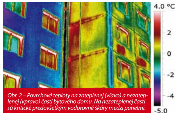
Obr. 2 – Povrchové teploty na zateplenej (vľavo) a nezateplenej (vpravo) časti bytového domu. Na nezateplenej časti sú kritické predovšetkým vodorovné škáry medzi panelmi.