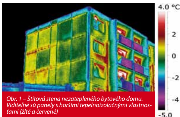
Obr. 1 – Štítová stena nezatepleného bytového domu. Viditeľné sú panely s horšími tepelnoizolačnými vlastnosťami (žlté a červené)

Tuhé zimy 2005/2006 a 2008/2009 intenzívne previerili konštrukcie z hľadiska tepelnej techniky. Vlhkostné poruchy