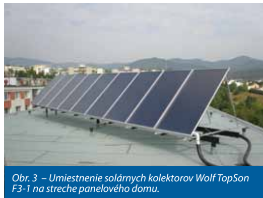
Obr. 3 – Umiestnenie solárnych kolektorov Wolf TopSon F3-1 na streche panelového domu.

Kogeneračné jednotky Wolf sú kompaktné zariadenia v kontajnerovom vyhotovení. Základným prvkom sú plynové motory MAN, ktoré môžu spaľovať zemný plyn, ale aj bioplyn či kalový plyn. Na motor