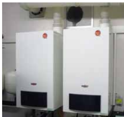
Obr. 1 – Závesný kondenzačný kotol CGB v kaskáde

Závesné kondenzačné kotly Wolf CGB do 100 kW sa s výhodou uplatnia aj pri nedostatočnom priestore v kotolni, keďže nevyžadujú žiaden bočný prístup a napr. kaskáda 4 kotlov umiestnená na stene má šírku len 2,3 m. Nezaťažuje vôbec podlahu kotolne, ktorá môže mať v starších objektoch malú únosnosť pre klasické technológie a dobré odhlučnenie kotla nevyvoláva ani ďalšie náklady na protihlukové opatrenia. Kotol môže byť zaťažovaný tlakom vody až do 6 bar, preto sa môže inštalovať aj vo vysokých budovách so zvýšeným hydrostatickým tlakom. Jednoduché ale aj kaskádové kotolne môže riadiť univerzálny riadiaci systém Wolf WRS modernej stavebnicovej koncepcie, ktorý zvládne pri príslušnej zostave mikroprocesorových regulátorov okrem riadenia kaskád aj riadenie vykurovania, ohrevu vody, vzduchotechniky či solárneho zariadenia na ohrev pitnej vody alebo podporu vykurovania.